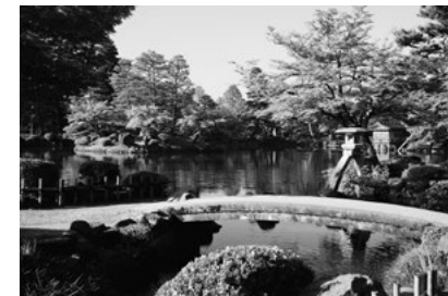
日本三名園の一つ「兼六園」 在留カードなど住所がわかるものを提示すれば、週末は無料で入園できます。