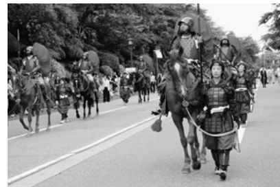
毎年6月の第1土曜日に「金沢百万石まつり」が盛大に行われます。

金沢市では、これらの資産を大切に、市民が誇れるまちであり続けるために、未来を見据え、世界の「交流拠点都市金沢」の実現をめざすとともに、誰もが暮らしやすいまちづくりの推進に取り組んでいます。