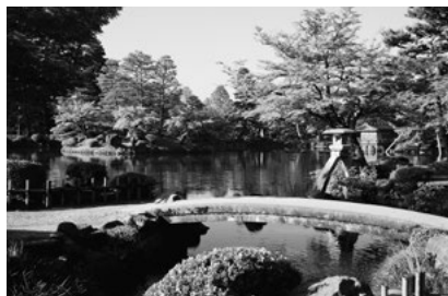
Kenrokuen, one of Japan's three most outstanding gardens If you show proof of residence (such as your residence card), you can enter for free on weekends.