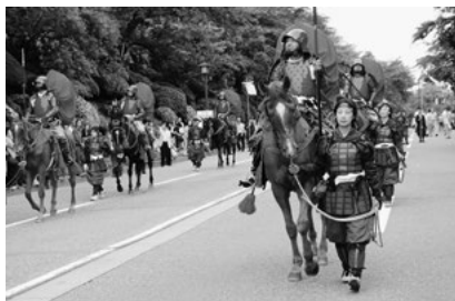
On the first Saturday of June every year, a grand festival called the Kanazawa Hyakumangoku Festival is held.

Kanazawa is blessed with natural waterways and greenery, with its mountains, nearby sea, and the Saigawa and Asanogawa rivers flowing down between three mountains. It's a place where you can experience the fascinating beauty of all four seasons. A city that prospered as a castle town under the Kaga Domain Maeda family, Kanazawa has deep cultural and scholarly roots. It has inherited many traditional art forms, including crafts such as Kaga Yuzen, gold leaf art, Kutani-ware (porcelain) and lacquer ware, as well as entertainment, including Noh theatre and Kaga-manzai (folk art). In June 2009, Kanazawa was recognized as the world's first UNESCO Creative City in the field of Crafts and Folk Art. In addition, because it escaped damage from natural disasters and war, even today many historical structures and townscapes remain. In Kanazawa, these assets are carefully preserved. In order to continue making Kanazawa a place its citizens can be proud of, we are looking to the future and aim to establish Kanazawa as a global "hub of international exchange" while striving to create an easy-to-live society for everyone.